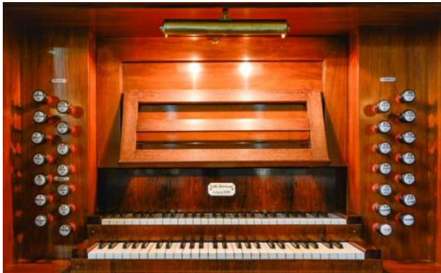
Spieltisch der Gottfried Hildebrand-Orgel (1890) in der Kirche Liebertwolkwitz